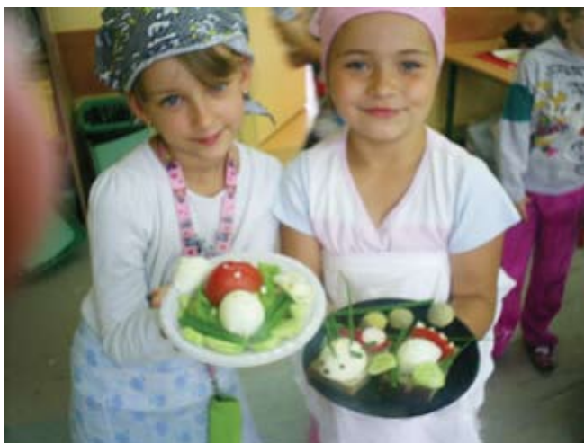
Razem przygotowujemy śniadania – wesołe kanapki

W preliminarzu wydatków rady rodziców uwzględniona jest pomoc w dożywianiu dzieci potrzebujących, 5% ogólnej kwoty wpływu przeznaczona jest na zakup śniadań dla tych uczniów.