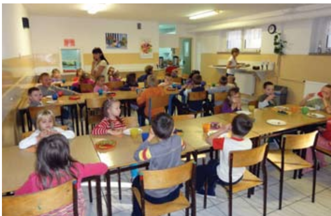
Wspólne drugie śniadanie w stołówce

We wspólnym śniadaniu uczestniczy 100 % dzieci z przedszkola i klas I – III oraz 90 % uczniów klas IV – VI. Wszystkie dzieci jedzą posiłek w stołówce szkolnej, w której są warunki do kulturalnego i spokojnego zjedzenia śniadania. Ze względu na wielkość pomieszczenia, w stołówce nie mogą przebywać jednocześnie więcej niż 3 klasy.