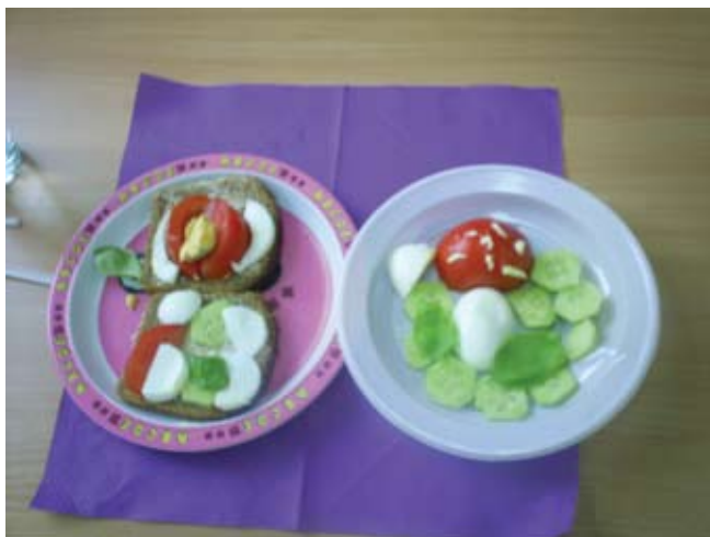
Potrafimy przyrządzić zdrowe śniadanie

Wspólne drugie śniadania traktujemy jako formę kształtowania u uczniów dbałości o własne zdrowie. Posiłki te są organizowane od 1995 r., wraz z przystąpieniem szkoły do wojewódzkiej sieci szkół promujących zdrowie oraz rozpoczęciem w 1996 r. realizacji przez cztery nauczycielki innowacji pedagogicznej „Edukacja zdrowotna w nauczaniu początkowym”. Stopniowo wspólne drugie śniadania zaczęto organizować we wszystkich klasach.