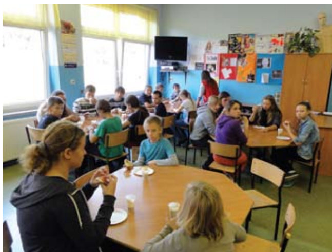
Drugie śniadanie w klasie

Każda klasa co najmniej 1 raz w roku uczestniczy w specjalnie przygotowanym posiłku w restauracji, gdzie uczniowie mają możliwość praktycznego zapoznania się z zasadami zachowania w miejscu publicznym oraz spożywania posiłków.