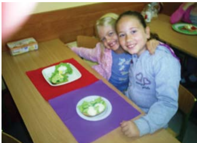
Wspólne śniadanie w klasie

Największą korzyścią z organizowania drugich śniadań w szkole jest możliwość wspólnego spożycia zdrowego posiłku w spokojnej, miłej atmosferze oraz kształtowanie poczucia odpowiedzialności za własne zdrowie.