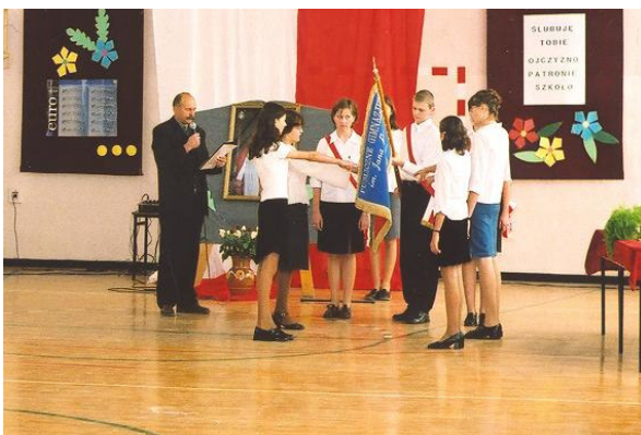
Pierwszaki podczas ślubowania