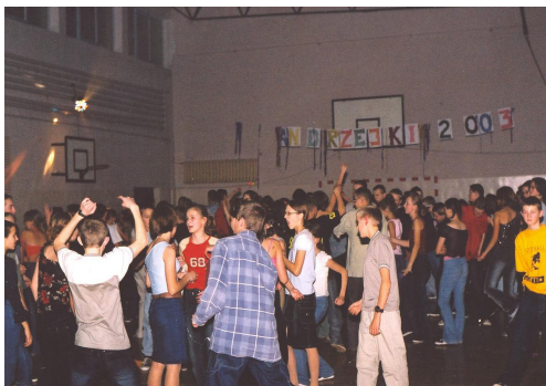
Nasi koledzy i koleżanki podczas zabawy

wszyscy ruszali do tańca, (no, nie licząc kilku osób, podpierających ściany). I tak to bawimy się, przy świetnej muzyce, o którą